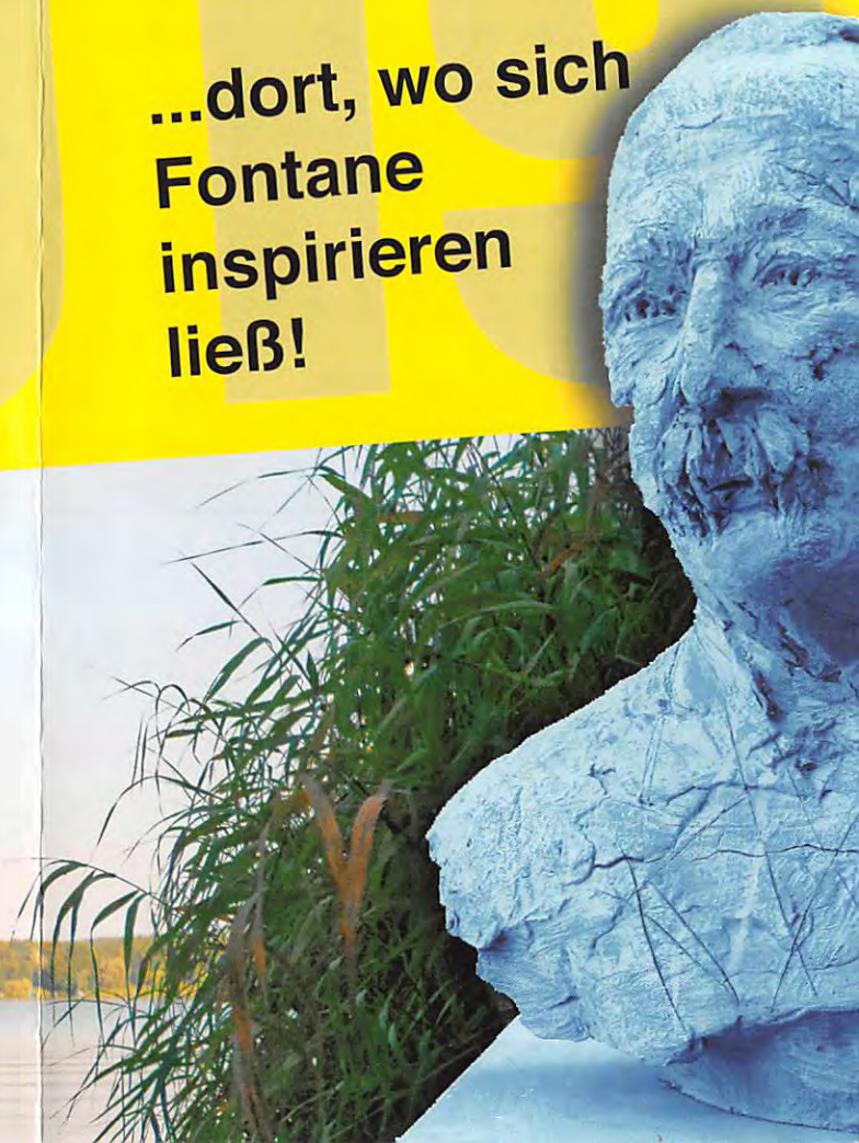
Foto: Jürgen Steinberg, Werder (Havel) „Schloßblick“ Foto: André Stiebitz, Schwielowsee/Tourismus „Schwielow“ Fontaneskulptur: Carmen Stahlschmidt - VG Bild-Kunst Herausgeber: Landkreis Potsdam-Mittelmark & Projektgruppe