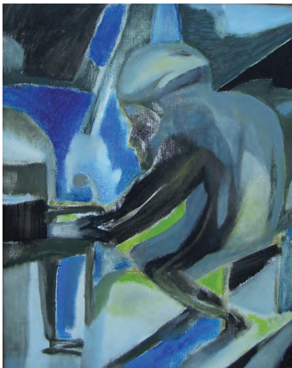
Thelonius Monk, huile sur toile, 50x40 cm, 1993