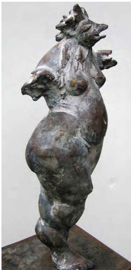
Au jardin Sculptures