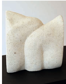
Wohnhaft in Corfe Castle in England

1949 geboren in Henstedt 1972-75 Ausbildung als Kunstlehrerin, Weingarten seit 1984 wurden ihre Skulpturen in über 200 Ausstellungen in lokalen, nationalen und internationalen Galerien gezeigt