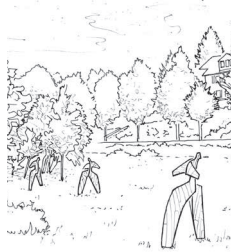
Wohnhaft in Villeneuve Saint Vistre in Frankreich

1953 geboren 1976 Diplom an der Supérieur de l'ENSAAMA, Paris seit 1976 Einzelausstellungen in unterschiedlichsten Institutionen seit 1990 alle zwei Jahre große Ausstellung im Atelier in Villeneuve Saint Vistre seit 1990 Bühnenbilder und Klangskulpturen